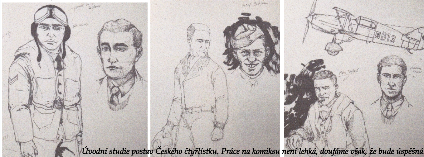
Úvodní studie postav Českého čtyřlístku. Práce na komiksu není lehká, doufáme však, že bude úspěšná.